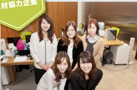
取材に協力頂いたのは、株式会社MEコーポレーション様